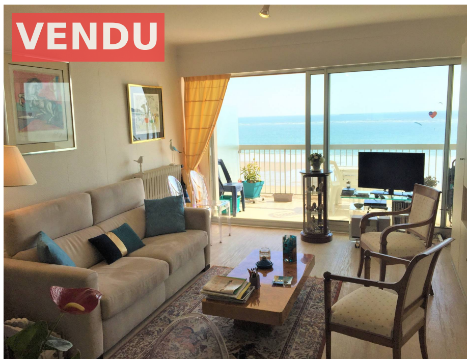
Viager occupé à LA BAULE face mer.

Honoraires : 36 960 € (5.5%) , Montant net vendeur : 250 000 € €