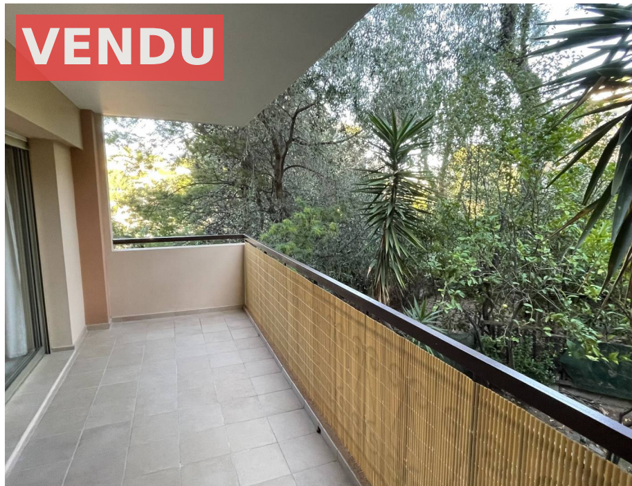
Appartement,f2,Roquebrune Cap Martin,06190,Alpes Maritime

Honoraires acheteur Honoraires : 9 990 € , Montant net vendeur : 0 €