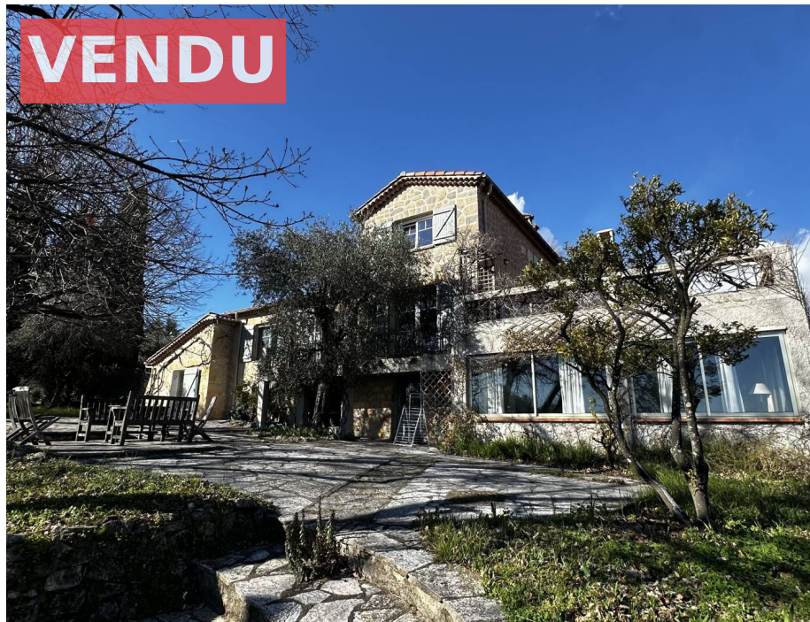
Villa,f8,345 M2,Dépendances,Opio,06650,Alpes maritimes

Honoraires : 120 000 € , Montant net vendeur : 50 000 € €