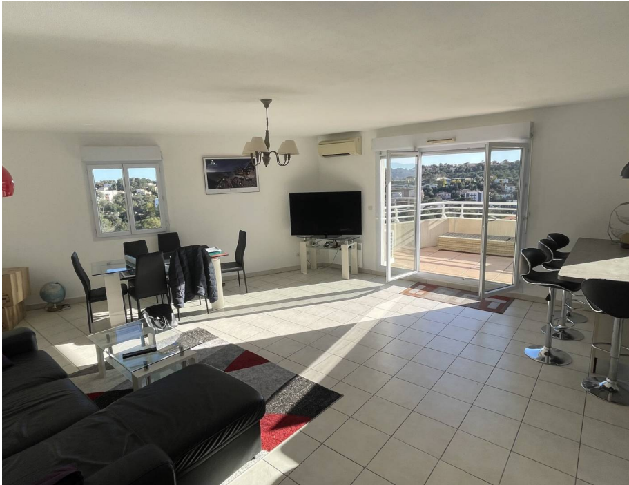
Appartement,f3,St Raphael,83700 Var.

Honoraires acheteur Honoraires : 28 000 € , Montant net vendeur : 0 €