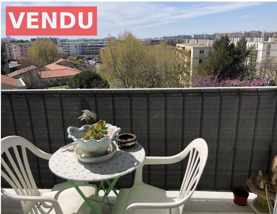
Appartement,f2,Marseille 13004,Secteur Montolivet.

Honoraires : 7 000 € , Montant net vendeur : 20 000 € €