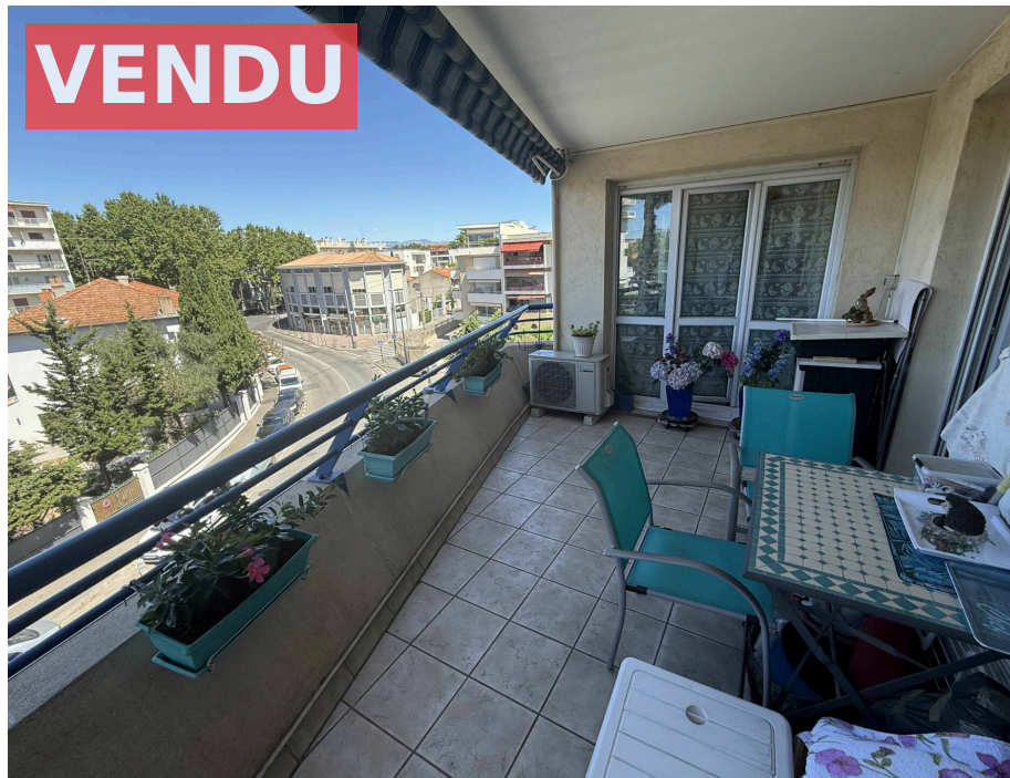
Appartement,f3,Fréjus,Limite St Raphael, Proche Plage,83600,Var.

Honoraires acheteur Honoraires : 19 990 € , Montant net vendeur : 40 000 € €