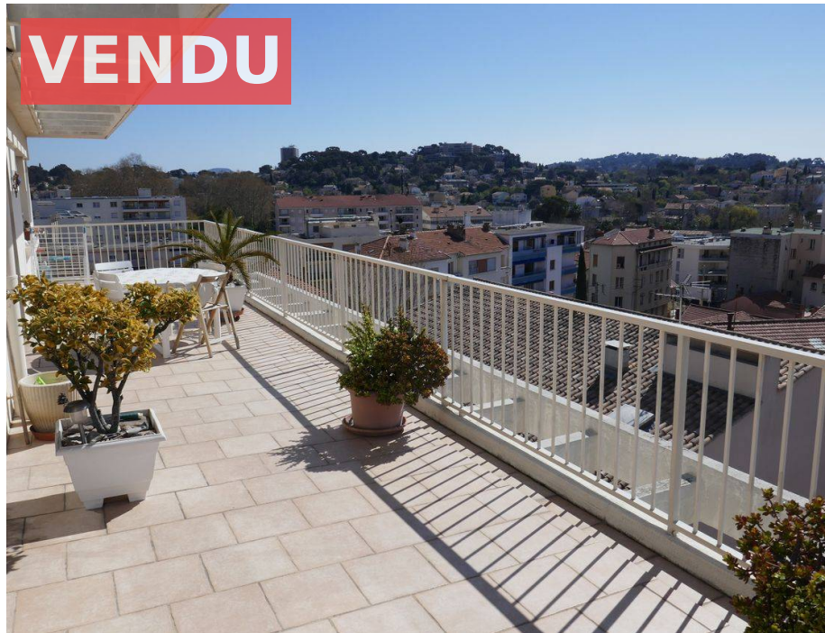
Appartement f2 à st Jean Du Var avec Terrasse de 80 M2 ,Toulon,83100,Var.

Viager Occupé, Mr de 75 ans et Dame de 78 ans.