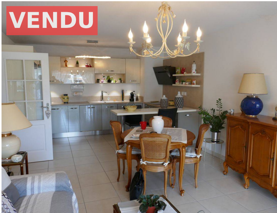
Appartement f3,Saint Raphael,83,Var.