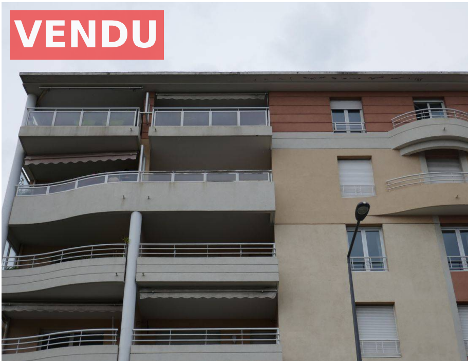
Appartement ,F3 ,Cannes la Bocca,06150,Alpes Maritime.