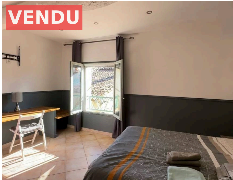
Viager Libre sur Homme de 90 ans

Honoraires : 9 900 € , Montant net vendeur : 130 000 € €