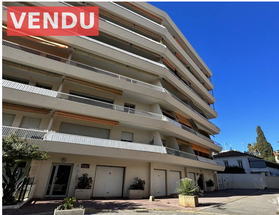
Appartement,f2, Cagnes sur Mer, 06800 ,Alpes Maritimes

Honoraires : 19 900 € , Montant net vendeur : 30 000 € €